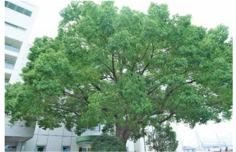
旧病院のクスノキ

〒375-8503 群馬県藤岡市中栗須813番地 1 公立藤岡総合病院 経営管理部 企画財政課 TEL 0274-22-3311 (代表) / FAX 0274-24-3161